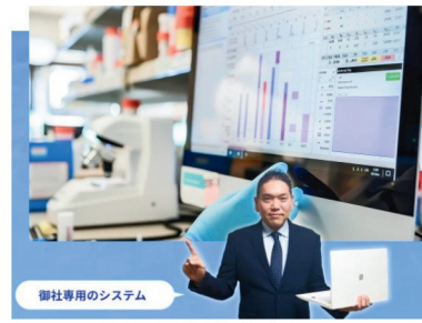
株式会社 大阪オフィス・オートメーション