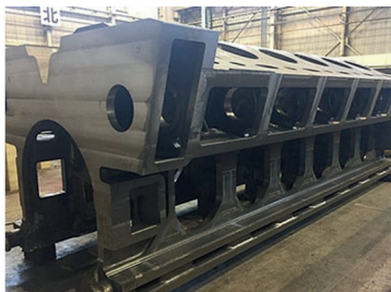
株式会社木村鋳造所