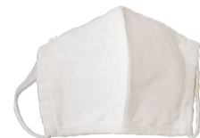
桐の調湿効果で湿気を吸収する布を 使用して、メガネがくもるわずらわさか ら解放される「桐糸マスク」を開発