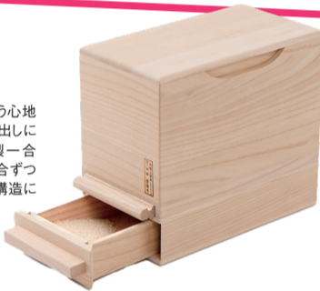
レバーを引くとシャーという心地 よい音がして、下の引き出しに 一合の米が落ちる桐製一合 計量米びつ。さっちり一合ずつ 計れて、米をつぶさない構造に なっている