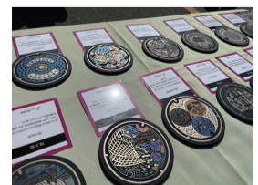
SNSを通じて柏原市の広報担当と つながり、今年3月から地域のイベント 「かしわらマルシェ」に参加するなど、 活動の幅を広げている