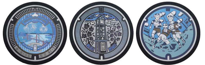
現在20種類ほど展開するチタン製ミニチュアマンホール。着色ではなく、 チタンの酸化被膜の厚さをコントロールして素材の色を出す。そのため 見る角度によって色合いも変わる

https://www.yasuoka.co.jp/ 柏原市国分東条町4331-1 TEL 072-976-0324