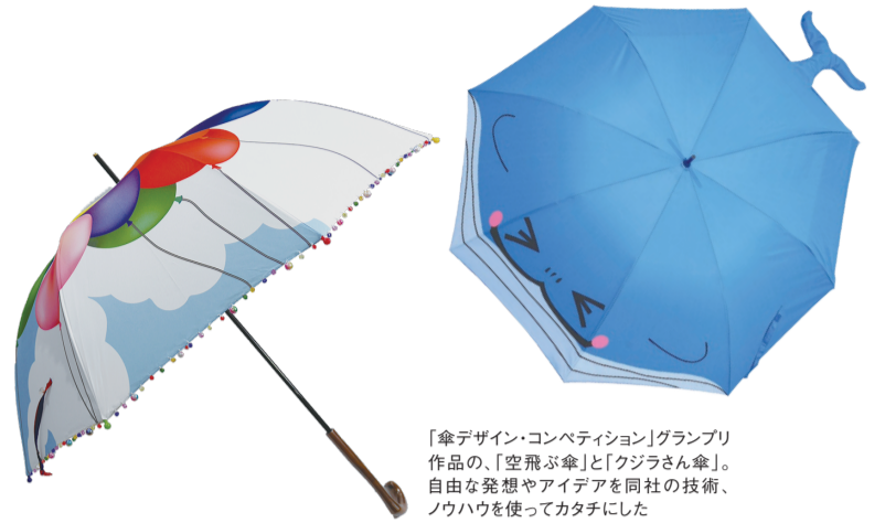
「傘デザイン・コンペティション」グランプリ 作品の、「空飛ぶ傘」と「クジラさん傘」。 自由な発想やアイデアを同社の技術、 ノウハウを使ってカタチにした

https://www.come-across.co.jp/ 東大阪市吉田本町1-11-10 TEL 072-967-2725