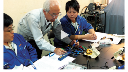
川原電機製作所の実技指導動画のひとコマ