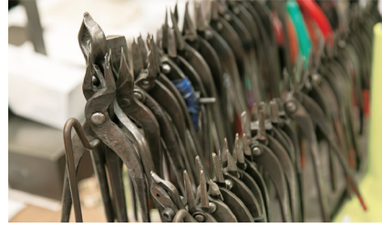
小さいばね作りに欠かせない道具