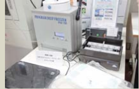
研究支援ツール・機器が並ぶショールーム