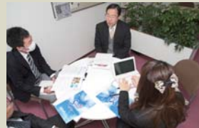
目標は、成功実績を増やしていくこと