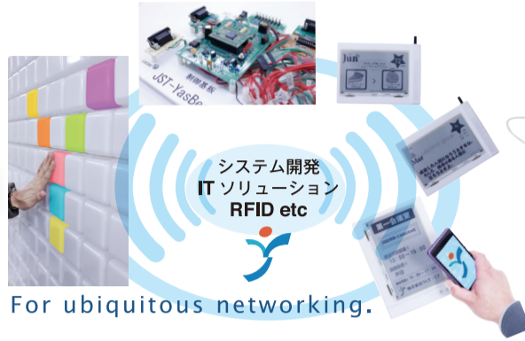
システム開発 ITソリューション RFID etc For ubiquitous networking.

ADD : 堺市北区長曾根町 3079-13 TEL : 072 254 5109 URL : http://www.yslab.co.jp/