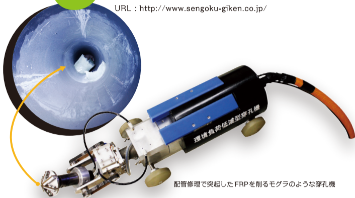
配管修理で突起したFRPを削るモグラのような穿孔機

ADD : 大阪市港区弁天 5-9-2 セズラ V502 TEL : 06 6599 9131 URL : http://www.sengoku-giken.co.jp/