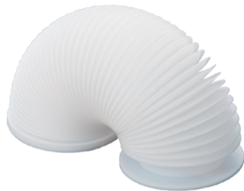
過酷な使用条件でも長期間使用できるため、半導体や化学プラントの部品として使用されている PTFE。削り出しでつくられたペロースは、空洞部にパイプなどを通して腐食から守る