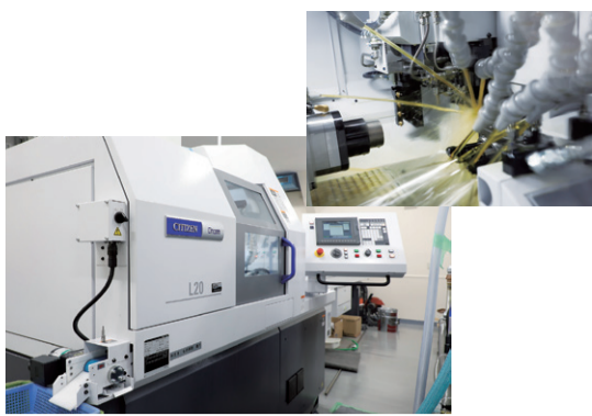
低周波振動切削 (LFV) 技術を搭載した自動旋盤機。管を通せないような場所に、刃先からピンポイントで油を出せるよう配置してもらうなど、こだわりぬいた1台で長時間高精度加工を実現

最近の切削加工技術は高度に発達し、一般材料では自動化・無人化が定着してきた。対して難削材の切削は、損傷が生じることで工具寿命が短くなったり、切削速度が速くできないなど能率上の問題もあり、無人化のハードルはまだ高い。切りくず処理の問題もある。そんな「難削材の無人化」に果敢に挑んだ企業がある。1961年に創業したツチャ精工は、バルブ部品の継手および関連部品の製作を手がけ、1980年には6軸旋盤の導入で真鍮製継手部品の大量生産を実現し、2004年からはステンレス部品加工を開始。先代から次男と三男が引き継いでからは、挑戦に次ぐ挑戦でこまできた。一昨年「難削金属材料の無人運転加工技術の確立」が大阪府から経営革新計画の