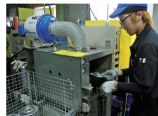
洗浄機と乾燥機を分けた二室構造と独自の可動式ノズルによる、圧倒的な乾燥力が特徴で、洗浄から乾燥までのサイクルタイムは約33秒