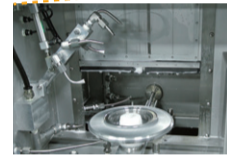
量産加工ラインのインラインで使用できる、業界最小クラスの洗浄機「洗浄小町」。自動車業界向け部品の残留コンタミ基準をクリア。特許出願中の独自の洗浄方式により、低コストと省エネを実現

そこで自分たちで製造したのが「洗浄小町」だ。大きさはそれまでの機械の1/20まで縮小。コンパクトなのでインライン化でき、加工している間に洗浄が終わるため工程をひとつ減らせて、工場内も広く使える。それを工場監査に来た顧客が気に入って、発注されたことが弾みとなった。最初は社内で使うだけだからと、配線もむき出しの状態から商品化に至るまでの約3年で、20台以上の洗浄機を製作した。2017年9月には大阪府の新分野・ニッチ市場等参入事業化プロジェクト支援事業にも採択され、現在は他分野の工場を見学しながらニーズを探り、販路拡大に取り組んでいる。またこれを機に、生産技術部を「洗浄事業部」へと変更。そこには「受託加工中心の企業からメーカーへの切り替えを図る」という、心意気が感じられた。