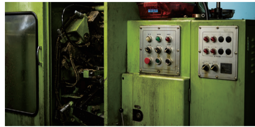
昨年まで30年以上稼働していた、同社の礎を築いた6軸旋盤。この機械は中身を入れ替えたレトロフィットタイプ。昔の鋳物なので、重さもあり熱にも強い

承認を受けたのを機に、約1年かけてベースとなる機械をカスタマイズ。高圧の切削油をピンポイントで刃物に当てることが要だが、メーカーに細かく注文して理想の切削環境の構築を実現させた。振動切削によって切りくずが細かく分断され、溜まらず絡まない。「他社が人材投入するのに対して、当社は最先端の機械を使いこなす」。それが自分たちの戦略。だから導入時には毎回細かなカスタマイズをおこなっている。最新の機械は素材を