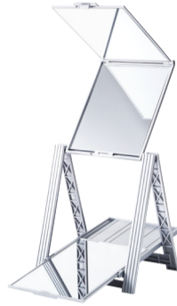
2014年12月に通販番組で紹介され1時間で2000台も注文が殺到した「ヘアチェック ナピュアミラー」

従来の鏡は鉄分を多く含むガラスを使っているため、光の青色が吸収されて白色がくすんで見える。そこで「日本人の肌色をよりナチュラルに再現したい」と鉄分をより多く取り除いた透明なガラスを使用し、アルミ真空蒸着製法による『ナピュアミラー』を開発。自然で純粋な色を映し出すことが可能になった。いち早くこの鏡に興味を抱いたのはビューティアドバイザーを育成するスクール。教材として使用するなど「ファンデーションの色合わせやポイントメイクに最適」と根強い支持を得た。こうして、美容のプロの要請を受けて生まれた『ナピュアミラー プロモデル折立ミラー』が大阪製ブランド2013に認定。「プロ仕様」「本当の肌色を映す鏡」という付加価値の高い鏡として注目を集めている。次は、頭頂部をチェックできる『ヘアチェック ナピュアミラー』を製品化。堀内鏡工業の開発はまだ続く。