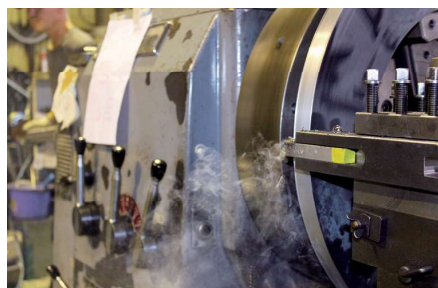
大型部品の加工を得意とする