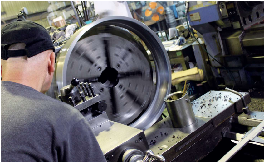
この道40年の職人の技が光る