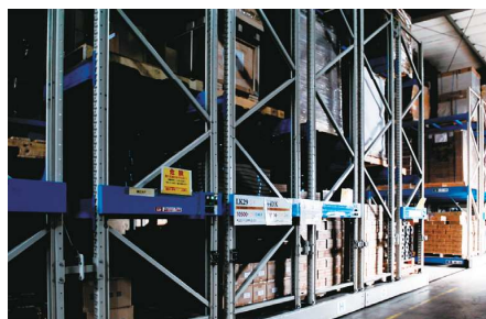
大阪府と福島県の自社倉庫より全国へ