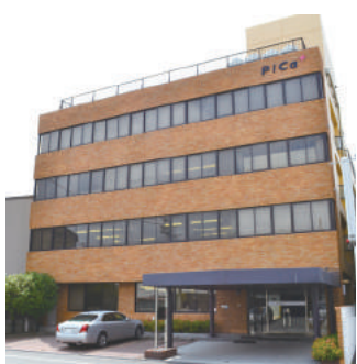
東大阪市にある本社

はしご、脚立、作業台、足場板などアルミニウム合金製品の製造を手がける。平成25年2月期の売上高67億円の内、約8割を業務用製品が占める。脚立や踏み台などの量産品、低価格品は中国の合弁会社で生産し、国内は業務用の標準品を中心にオーダーメイド生産にも対応する。平成22年に同業のアルインコ株式会社と資本業務提携し、製品開発などで協力している。同年に中国で販売会社を設立しており、現在は日系企業向けに販売している。今後、東南アジアやオセアニアなどへの展開も視野に入れている。